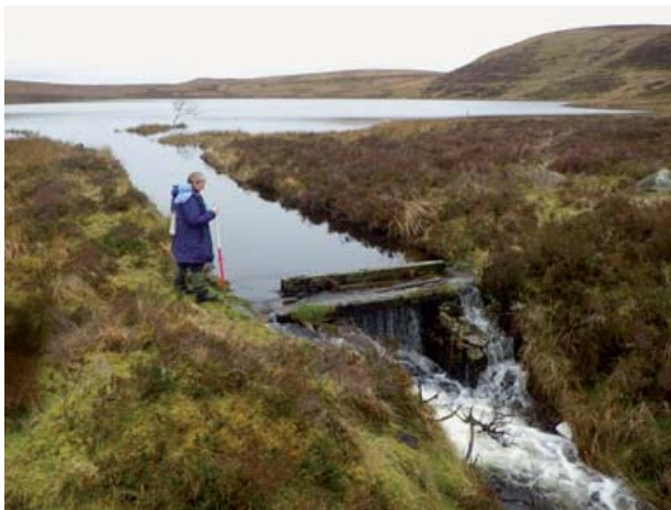
Argae fach, Llyn Gwyddior, yn ardal Llanbryn-mair, Maldwyn A small dam, Llyn Gwyddior, near Llanbryn-mair, Montgomeryshire