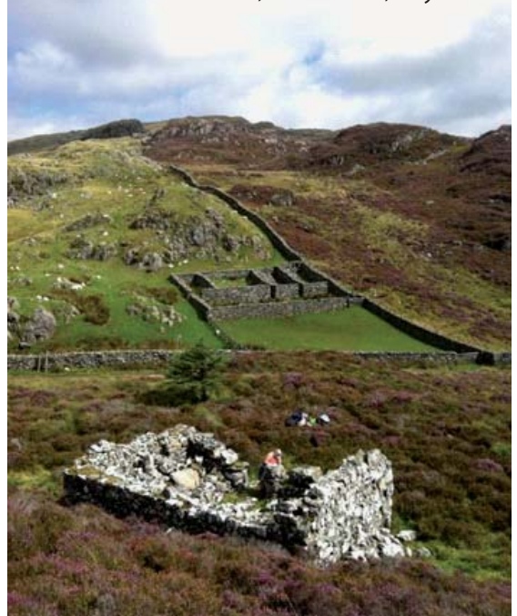
Wrth droed y Rhobell Fawr, Llanfachreth, Gwynedd At the foot of Rhobell Fawr, Llanfachreth, Gwynedd

Trist nodi taw hon yw blwyddyn olaf Menter yr Uwchdiroedd, gyda 100 cilometr sgwâr heb ei orffen.